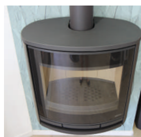
Vue de dessus