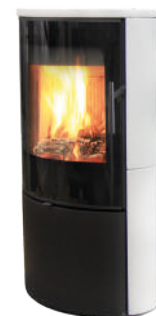
Céramique blanc mat