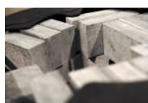
INCLUS 1 KIT DE 33 KG D'ACCUMULATEUR DE CHALEUR EN PIERRE OLLAIRE