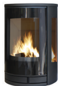
Acier noir cotés vitrés