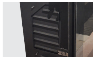
ÉCHANGEURS THERMIQUES EN FONTE