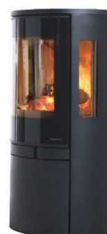
Acier noir cotés vitrés