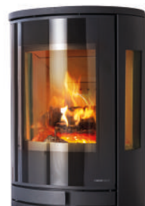
Acier noir cotés vitrés