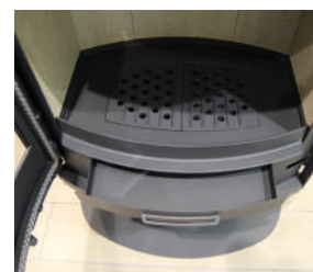
Tiroir cendrier indépendant