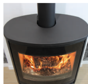
Vue de dessus