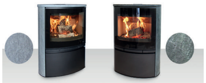
MABLY Pierre ollaire Acier noir